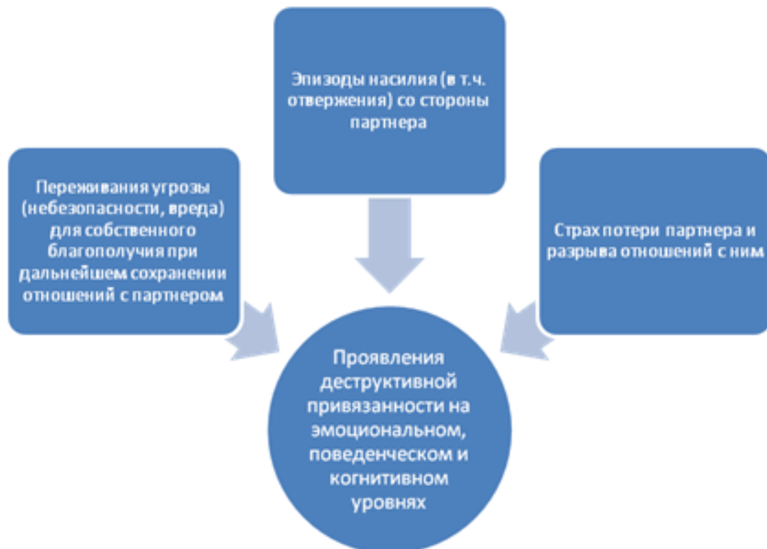
Рис. 1. Основные характеристики отношений, выступающие источником стресса и стрессогенных проявлений деструктивной привязанности.

В отношениях субъектов деструктивной привязанности как близость к партнеру, так и отдаленность от него имеют особую стрессогенность для субъекта. Это связано, как с особыми характеристиками отношений, так и со специфическим переживанием угрозы их разрыва, описанными выше, вызывающими негативные проявления данной привязанности (см. рис. 1).