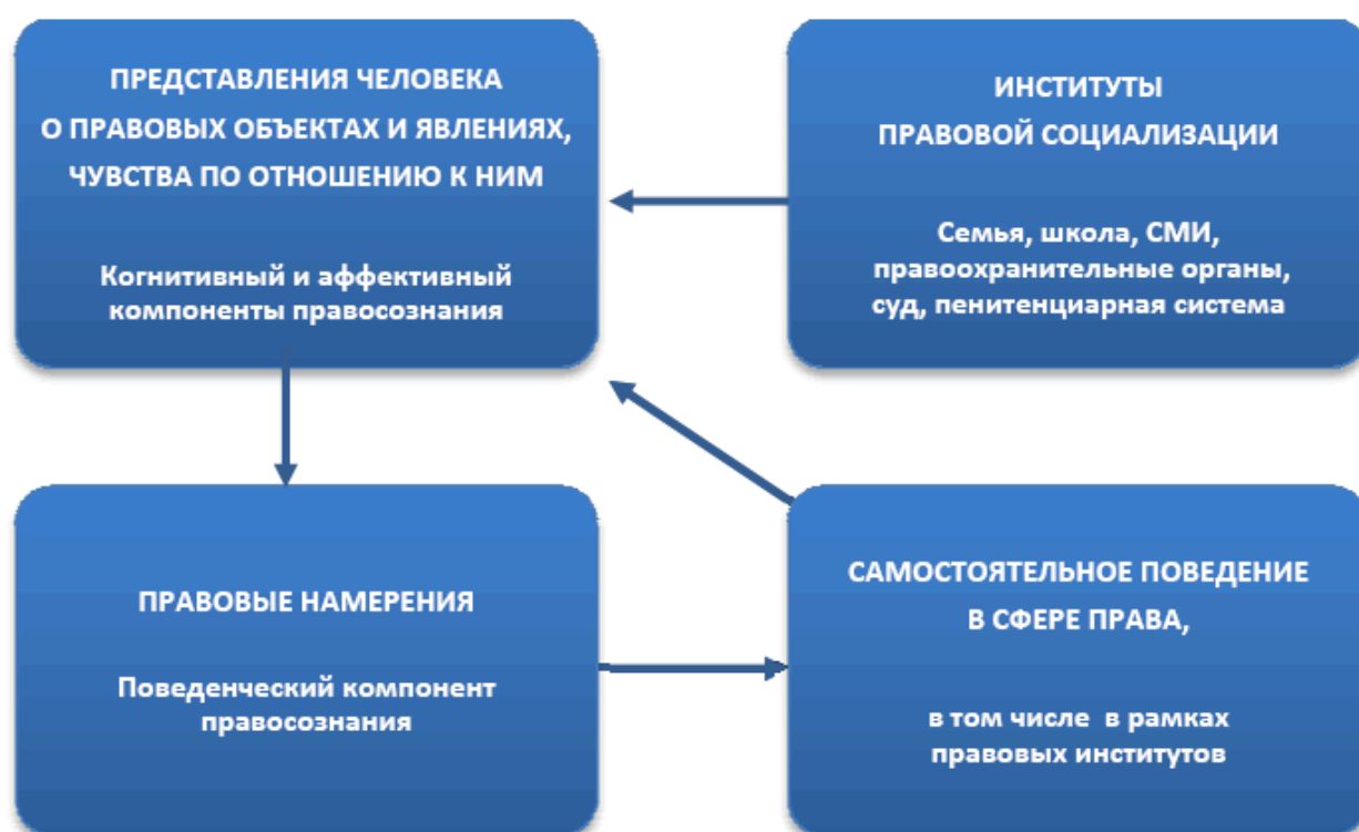
Рис. 2. Подходы к изучению правосознания.

Соотношение двух подходов к изучению правосознания схематично представлено на рис. 2. Из рисунка видно, что на формирование правосознания человека оказывают влияние как окружающие люди (институты правовой социализации), так и его собственное поведение, принятие новой для себя роли и ответственности, позволяющее посмотреть на происходящее под иным углом зрения.