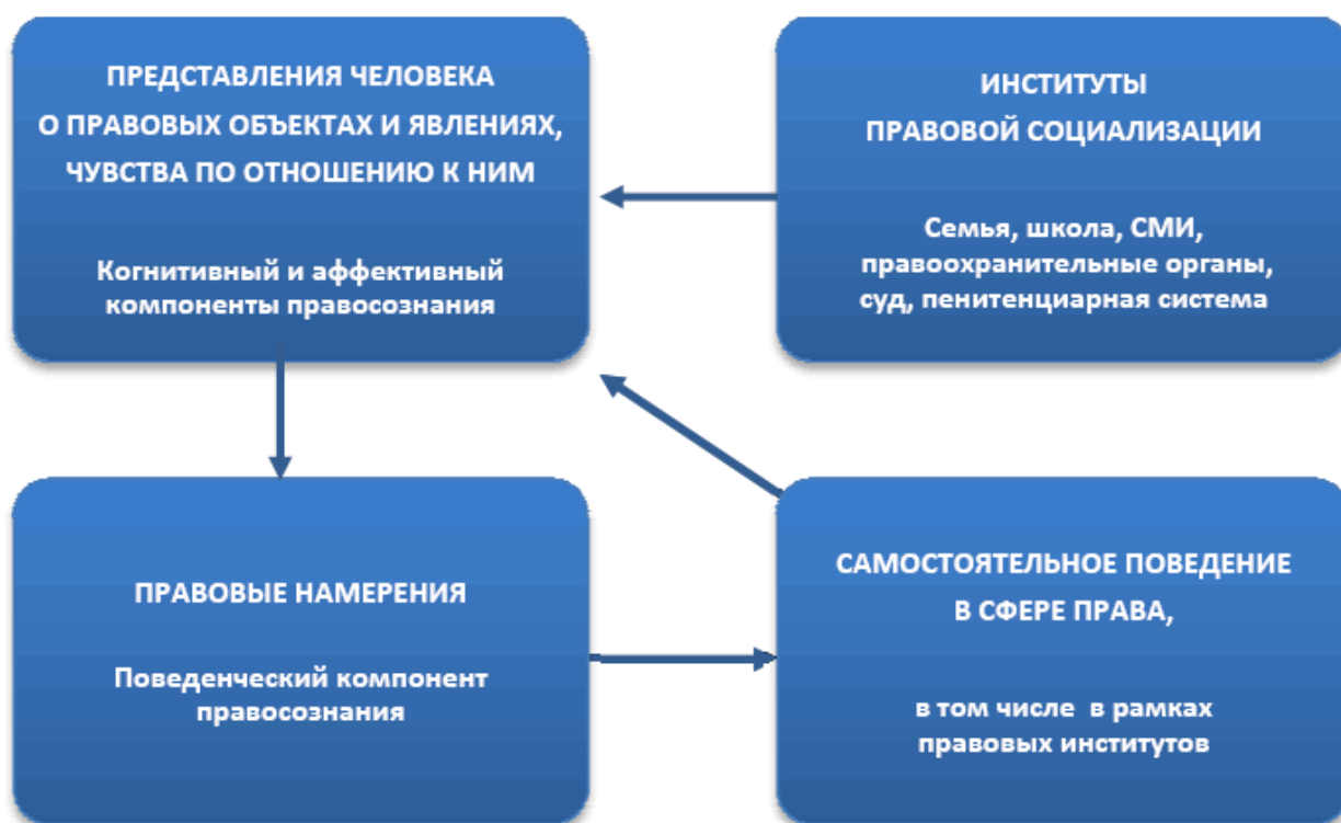
Рис. 2. Подходы к изучению правосознания.

Соотношение двух подходов к изучению правосознания схематично представлено на рис. 2. Из рисунка видно, что на формирование правосознания человека оказывают влияние как окружающие люди (институты правовой социализации), так и его собственное поведение, принятие новой для себя роли и ответственности, позволяющее посмотреть на происходящее под иным углом зрения.